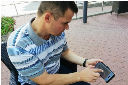
Tänä päivänä isännöitsijä voi säätää ilmanvaihtoa vaikka matkapuhelimella.

- Tutkimuslaitoksen nurmikoiden leikkuu otti aina kolme työpäivää. Siinä ehti miettimään, että tätäkö tekisin työkseni loppuikäni. Eikö muuta ole? Kun isännöitsijän paikka tuli Salon seudulla avoimeksi niin hain sitä ja sillä tiellä ollaan oltu kohta 28 vuotta.